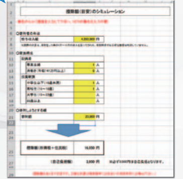
総務省のHPよりダウンロードしたエクセルシートで簡単にシミュレートできます。

みなさん、ふるさと納税という言葉をご存知でしょうか?。さて、ふるさと納税とは、お気に入りの自治体に寄付をし、その寄付先の自治体からお礼の品をもらい、寄付した金額の一部を納付した所得税、住民税等から確定申告をして還付を受けると言う仕組みです。この仕組みも収入、ご家族構成、また納税額により確定しますので、現段階では納税額が確定せず、あくまでどの位の税金が還付されるかといった感じです。総務省のHPに収入・家族構成を入ると、還付されるおおよその税額が判るエクセルシートがあります。右中段のQRコードからエクセルシートをダウンロードしてお試しください。